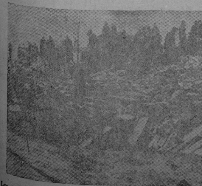
Los habitantes de Riddiken taponan con sacos terrenos y otros materiales la brecha abierta por la galerna en uno de los diques