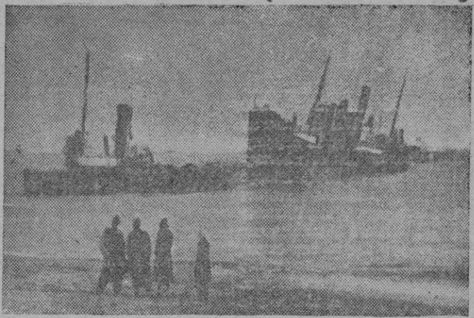
Un remolcador trata de poner a flote al mercante español «Castillo Tordesillas» que encalló en la costa de Dover durante el temporal