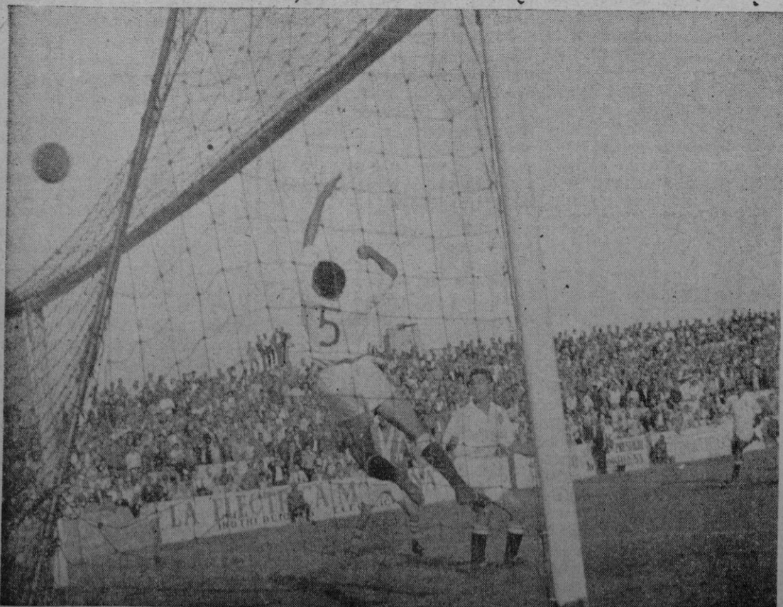
He aquí una oportunísima fotografía del discutido penal que el árbitro no vió. Pero ahí estuvo el objetivo que documentó el hecho. «A i posteri l'ardua sentença...»