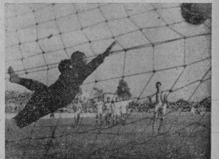
El penal contra los visitantes es convertido en gol por Barceló I, quien desvia el balón y lo manda al fondo del marco local. Faltando unos cinco minutos para finalizar la lucha, de fuerte y colocadísimo disparo, Alorda transformó en gol un golpe franco que tiró desde fuera del área.