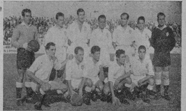
El equipo del Jaén, que demostró en «Son Canals» que no en balde ocupa la cabeza de la clasificación de su grupo

A los diez minutos después del descanso Bomba burla a Duel se interna y sirve flojo a Ague-