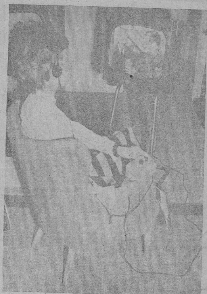
He aquí un nuevo modelo de receptor de televisión, con auriculares para el sonido y mando automático a distancia, expuesto en el certamen de Radio y Televisión de Londres