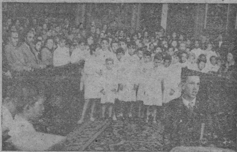
Aspecto que presentaba el Salón de sesiones del Ayuntamiento durante el acto allí celebrado, ayer al mediodía, con motivo de la Fiesta del Libro