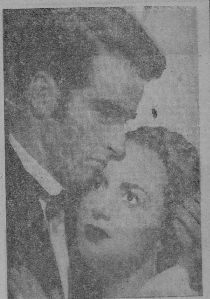
LA HEREDERA fué una mujer sedienta de amor pero demasiado orgullosa para comprarlo.

INGLATERRA Y FRANCIA A impulsos de una política realista, la Gran Bretaña y la República Francesa, han seguido la evolución internacional que nos es favorable. A ello han contribuido también en el año transcurrido, los cambios electorales acaecidos en ambos países, cuyos nuevos gobiernos parecen mostrarse mejor dispuestos para las cosas de España, una vez reintegrados a Madrid sus respectivos embajadores.