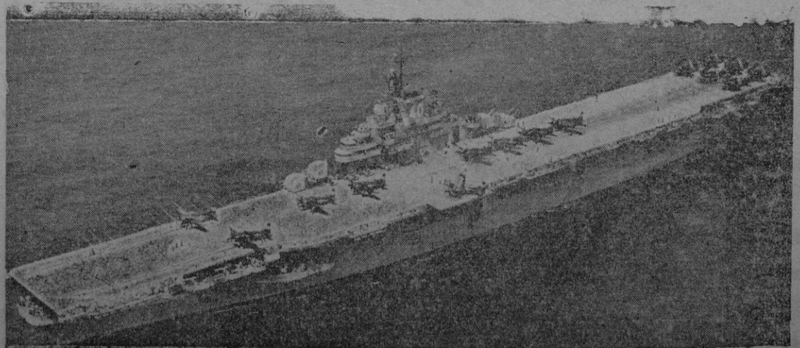
Hermosa vista del portaaviones "Tarawa" surto en nuestras aguas