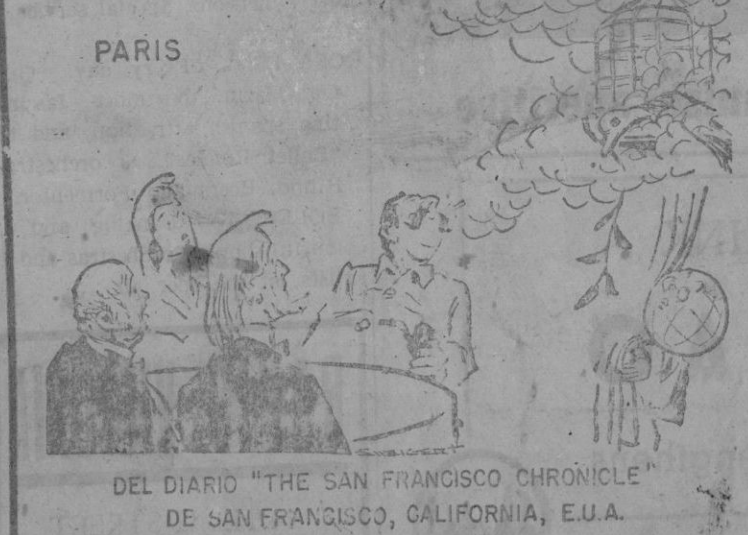
DEL DIARIO "THE SAN FRANCISCO CHRONICLE" DE SAN FRANCISCO, CALIFORNIA, E.U.A.

Mientras tanto van llegando noticias de ruptura de negociaciones desde Kaesong y Teherán, casi al alimón, recordemos que se anuncia para el 4 de septiembre la Conferencia de San Francisco para aprobar y firmar el Tratado de Paz con el Japon. Con ese documento se cerrará un doloroso capítulo en la Historia de los pueblos del Extremo Oriente, abierto en la mañana del 7 de diciembre de 1941 con el ataque a Pearl Harbour en las Islas Hawai. Las cosas del Oriente lejano son aún para muchos europeos un misterio. Y nos olvidamos con demasiada frecuencia que los grandes problemas del futuro se han de resolver en el Oriente. Porque aquel Oriente Lejano está poblado por casi dos tercios de la humanidad, que si hasta ayer durmieron un sueño de miles de años, ya comienza a despertar como un gran gigante que es y quiere incorporarse al mundo. Será, pues, en esta Conferencia de San Francisco de California donde se va a decir cual será ese futuro del Extremo Oriente. Lo de menos en esa Conferencia habrá de ser lo que se estipule, aunque ello tenga mucha importancia. Lo importante serán los caminos políticos y económicos que en esa Conferencia se traten. La Rusia Soviética asistirá a ella con una delegación compuesta de 33 miembros y presidida por Andrei Gromyko, Vice-Ministro de Asuntos Exteriores y hombre "rollo" por excelencia,