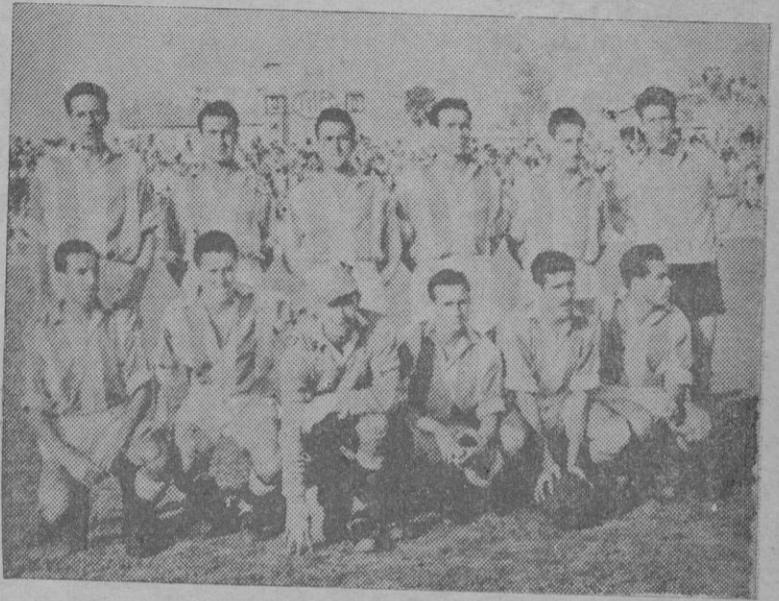
El equipo del Atlético Baleares que con su brillante victoria del domingo puede ya ser considerado campeón de la liguilla