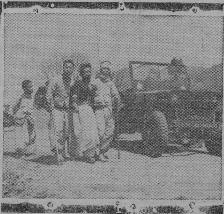
Hollando las asperas carreteras que conducen a una relativa seguridad física, una madre coreana, ayudada por sus tres hijos, inicia el éxodo y abandona su solar donde se ha establecido la línea de fuego