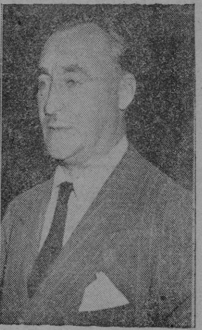
Primo de Rivera

El nuevo embajador altos funcionarios, que le acompañaron hasta el salón en que se verificó la ceremonia de