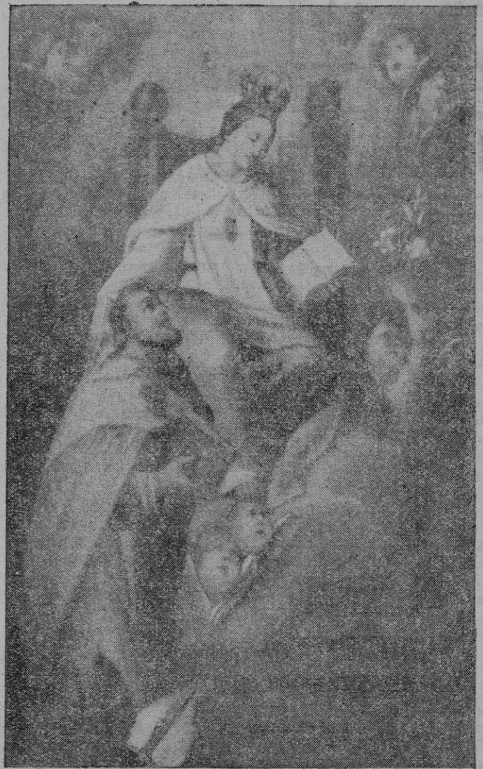
Nuestra Señora de la Merced cuya festividad se celebra hoy

Neuss (Dusseldorf, Alemania). El general Hans von Manteuffel, excomandante en jefe de las divisiones blindadas alemanas y actual jefe de exportaciones de una pequeña fábrica de tornillos, ha declarado a un corresponsal de la agencia Reuter, que el negocio en que trabaja va demasiado bien para que tenga tiempo de ocuparse de política