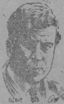
Ramón Gómez de la Serna

Al filo de la amanecida, la tertulia literaria de Pombo adquiría su más vivo color, todo era allí