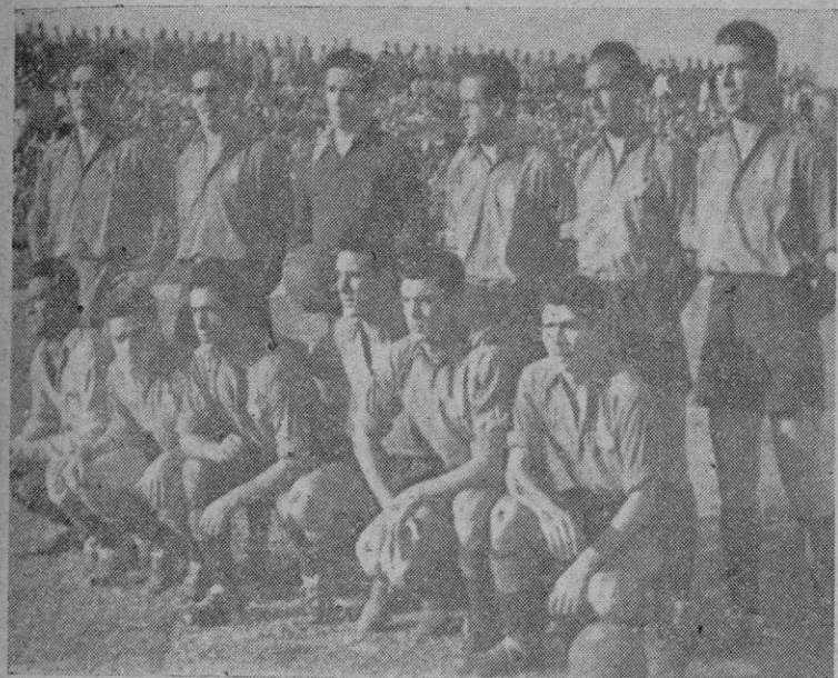
El equipo del R. G. -Mallorca

En la primera mitad de la contienda los visitantes dominaron más, ejercieron mayor presión y jugaron mejor que los mallorquines. Refleja lo dicho el que los tetuanes tiraron en esos 45 minutos cuatro corners y uno solo los locales. Sin embargo, se llegó al descanso señalando el marcador 2-1 favorable a los locales, tanto esperanzador que no pudo mejorarse, pese a las ocasiones que se registraron después, ni tampoco logró mantenerse por un fallo de la defensa encarnada, lo que equivale a la pérdida de un punto que no dudamos en reconocer será algo más que difícil recuperar. Por ahora no vemos a los once hombres capaces de conseguirlo. Los hay en el equipo, pero no están los once, ya que no debemos olvidar que siempre serán once los que se opondrán a que el Mallorca mejore la ingrata clasificación que lleva ahora.