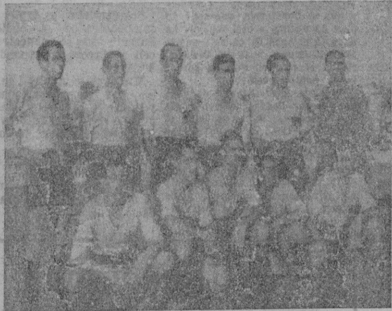
El equipo del Orihuela