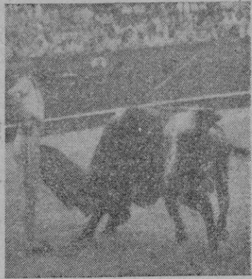
Paquito Muñoz, en uno de los naturales que instrumentó al que abrió plaza