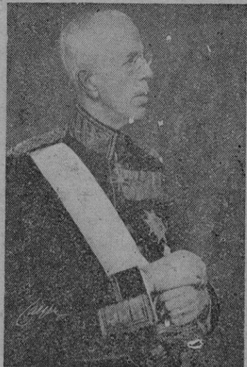
Gustavo V. de Suecia, el Rey tenista

Entre los deportes que, sin ser de grandes masas de público, aumentan la esfera de su influencia y popularidad se encuentra el tenis, deporte duro aunque de una fina y grácil, de estampa elegante. El tenis, a pesar de no ser deporte popular y democratizado, aunque lo practiquen algunos dilettantes de Moscú— es quizá uno de los deportes que, en esta época, toman parte más activa en los esfuerzos fructíferos que se realizan para devolver a Europa y al mundo, algo de aquel perfil noble y sonriente de "avant-garde". Los torneos se suceden y se generalizan. Unos tradicionales y otros recientes. La Copa Davis— que es por su categoría el más famoso de cuantos se disputan en el mundo— vuelve por sus andamios y las renombradas pistas internacionales de Wimbledon, París, Estocolmo, etc., repiten sus clásicas competiciones.