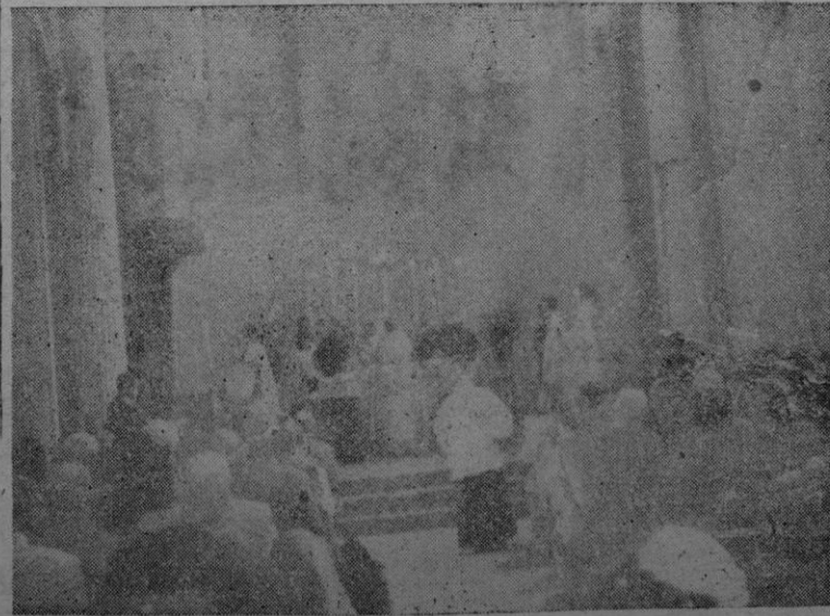
Durante la ceremonia de la bendición

Terminado el acto los asistentes fueron deheadamente obsequiados. El Prelado bendijo a los reunidos.