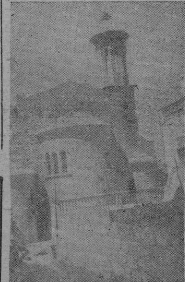
Una vista del nuevo templo

A las diez de la mañana del domingo lugar el acto de la bendición de una nueva parroquia en San Jordi.