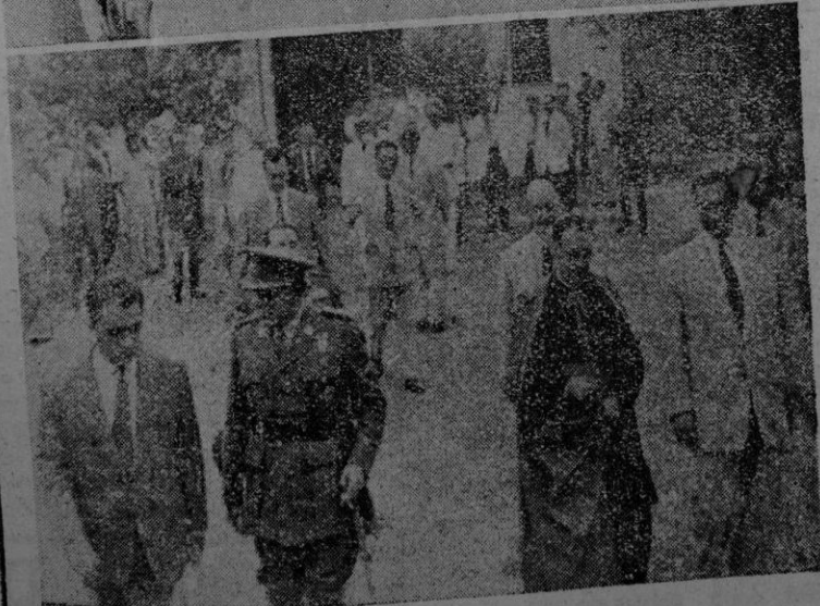
Las autoridades visitando los boxes donde se hallan instalados los sementales adquiridos por el Instituto. -- El Excmo. señor Obispo, Excmo. señor Capitán General, Excmo. señor Gobernador Civil y Presidente de la Excmo. Diputación a su llegada al Instituto. (Información en las páginas interiores)