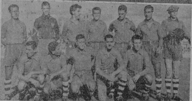
Arriba: Un momento de apremio frente a la puerta de los visitantes. Abajo: el equipo del Segarra

Arriba: Boti; Marínez, Magriñan; Talamantes, Limaña, Villalta, Medgo y Sebastián.