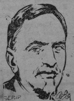
S. E. HACHEM BEY ATASSI

Por dos veces en cinco meses, Siria ha cambiado de gobierno. Hachem Bey Atassi ha formado un nuevo gabinete para preparar unas futuras elecciones. El mandato gubernamental le fué entregado por la junta militar que ordenó la ejecución del mariscal Zaim. Hachem Bey Atassi fué presidente de la República siria en 1949 y es padre del actual ministro de Siria en la capital francesa. El nuevo gabinete sirio tendrá como directriz política el más ferviente anticomunismo, según expresión de sus mentores. (Scrip).