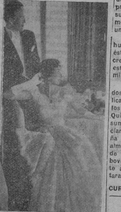
Típico modelo de traje de baile para jovencita confeccionado en batista bordado