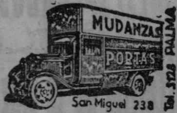
San Miguel 238

Los expedicionarios marchan poseídos de alta moral.