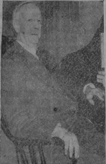
Doctor Gilbert Grosvenor, editor de la Revista de Geografía

geografía una palabra familiar y casera en toda la nación americana, siguiendo su lema de "divulgar hasta el máximo el conocimiento geográfico". Bajo la dirección de Grosvenor la revista ha alcanzado límites insospechados. Basándose en su teoría de que no deben trazarse líneas divisorias entre las ciencias y de que la geografía representa en un sentido la suma total de la experiencia humana, la revista ha producido artículos sobre antílopes, ranas, elefantes, aves; sobre selvas, ciudades, territorios polares; sobre usos y costumbres de todos los pueblos y países; sobre el mar, sobre la estratosfera, sobre el sol, sobre ríos y montes, sobre barcos, ejércitos y aviones. Sus editores y fotógrafos viajan continuamente por todas partes del globo en busca de material para sus temas.