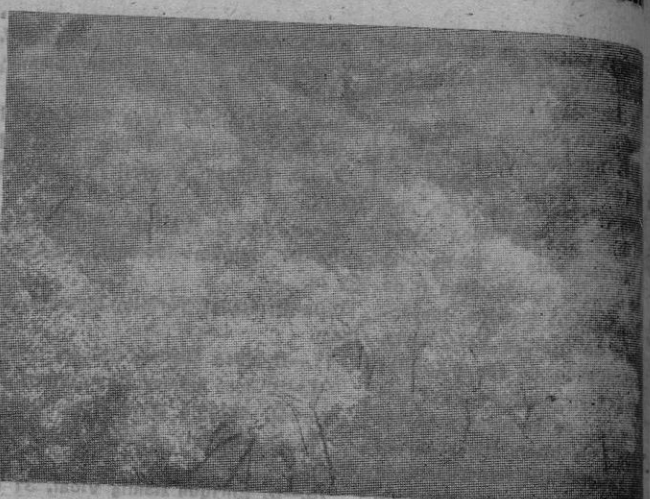
Probablemente, más que el corazón del invierno, reunirían encantos las semanas de los almendros en flor