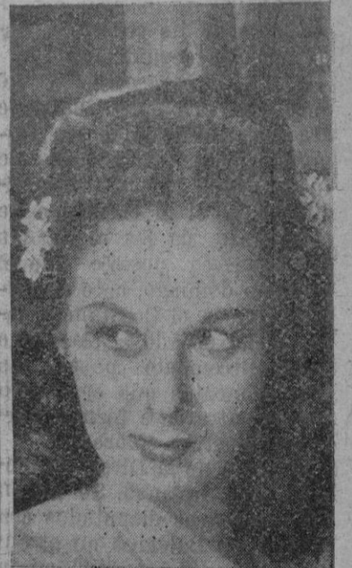
Susan Hayward, la bella artista, que muestra también sus dotes de cocinera

1/2 onza de levadura, 1/2 taza de leche caliente 2-1/4 tazas de harina de trigo, 1/2 taza mantequilla, 3 cucharadas de azúcar,