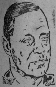
SIR WILLIAM ELLIOT

El nombramiento de Sir William Elliot para la jefatura del Estado Mayor de Ministerio de Defensa, refuerza la importancia que en dicho Ministerio británico se concede a la defensa aérea y, en general, a la arma aérea, en un futuro concepto bélico. No hay que olvidar la habilidad y la estrategia de Sir William como primer jefe de las fuerzas aéreas que defendieron Inglaterra deben los ingleses un indudable reconocimiento a su admiración. (Scrip).