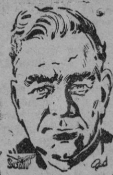
W. J. EDWARDS

En las actuales circunstancias en que tanto se habla de la defensa de Europa, desempeña un papel de indudable trascendencia la flota británica cuyos efectivos han sido aumentados recientemente. Entre los jefes ingleses, figura Mr. W. J. Edwards, Lord Civil del Amirantazgo y un auténtico especialista en cuestiones navales. (Scrip).