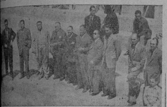
Elementos directivos de la natación nacional e insular, junto a la piscina del C. N. Palma