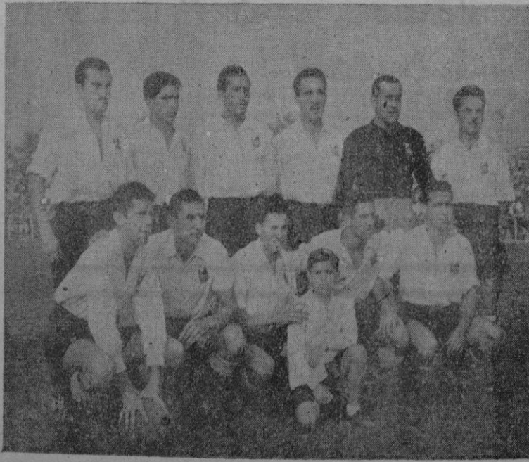
El "Constancia" que jugó el partido con gran deportividad