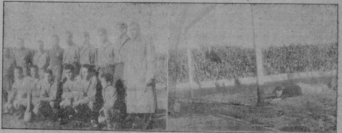
El equipo del Mallorca que venció brillantemente al Constancia. — Uno de los goles del Mallorca.

principio dominó con mayor insistencia el Constancia, pero poco a poco fue nivelándose la lucha para pasar después a la ofensiva el Mallorca y haciéndose dueño de la situación, llevó la iniciativa y presionó durante toda la segunda mitad, mejorando su actuación, que llegó a ser buena. El resultado que se registró refleja la diferencia que conjuntamente separa a los dos equipos, muy especialmente en las partes defensivas y además la preparación física, el fondo que notose es bastante diferente, y él influyó en el desarrollo del partido.