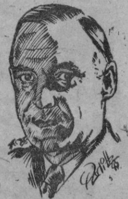
General Lucius D. Clay

ron en suspenso porque se interpuso apelación ante el Tribunal Supremo de los Estados Unidos, lo cual es normal. Dicho alto Tribunal se declaró incompetente y ante tal hecho pedí el nombramiento de una comisión para que investigara a fondo los diversos casos y formulara recomendaciones independientemente de la Comisión militar de revisión.