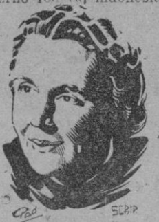
La reina Juliana

Amsterdam, 6. Ante el micrófono, la reina Juliana de Holanda ha pronunciado un discurso hasta el que dijo que la acción militar contra Indonesia se hizo inevitable cuando los grupos perturbadores de la colonia dominaron los elementos que querían colaborar con la metrópoli. Expresó la esperanza de que en el plazo de unas semanas se formara un Gobierno federal indonesio que los Estados Unidos de América, el Reino Unido y el Imperio Británico, la Unión Soviética y la Unión Indio-holandesa.