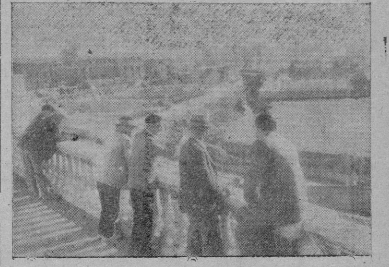
La magnífica situación del edificio, nos permite saturarnos de aire, de sol... y de paz

--Es ciega. Hace mucho tiempo que no ve --nos dice una hermana--. Sin embargo vea con que primor va arreglando esta silla. Siempre trabaja; siempre... --Sí, señor... Siempre trabajo. Estoy muy a gusto aquí, con las monjas y con mis amigas. No veo a nadie, pero por el tacto conozco a la hermana que puso su mano en mi cabeza. Mis ojos están ciegos, pero dentro de mí parece que llevo una vela encendida. Siéntese a mi lado. ¿No me ve? Ya sé que voy a salir muy fea en la fotografía porque el Buen Jesús no quiso darme una cara más guapa. Pero, ¿qué importa? No he de verme nunca... Y ha dejado deslizar su mano hasta las nuestras mientras decía: --Ahora ya, cuando vuelva, si me deja acariciar su mano ya le conoceré... La frase de esta santa mujer me ha impresionado profundamente. Por esto cuando en nuestro itinerario hemos abandonado el corredor lleno de sol y de ancianas he seguido un rato largo con la mirada vuelta hacia aquella mujer que miraba al cielo en una mirada eternamente ciega.