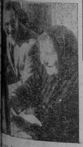
San Jesús no quiso darme una foto más guapa. Pero, ¿qué importa? No he de verme nunca...