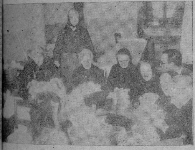
entre ellas hemos querido tomar asiento, para verlas trabajar... y para que nos cuenten sus cosas