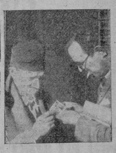
entiende, ¿verdad? Después de todo, aquí no se está tan mal. Es una pena que la gente no lo conozca como lo conocen ustedes en este momento.