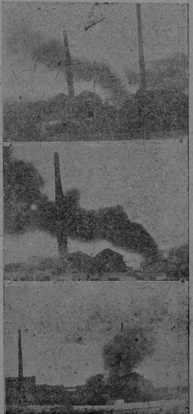
Tres momentos del siniestro