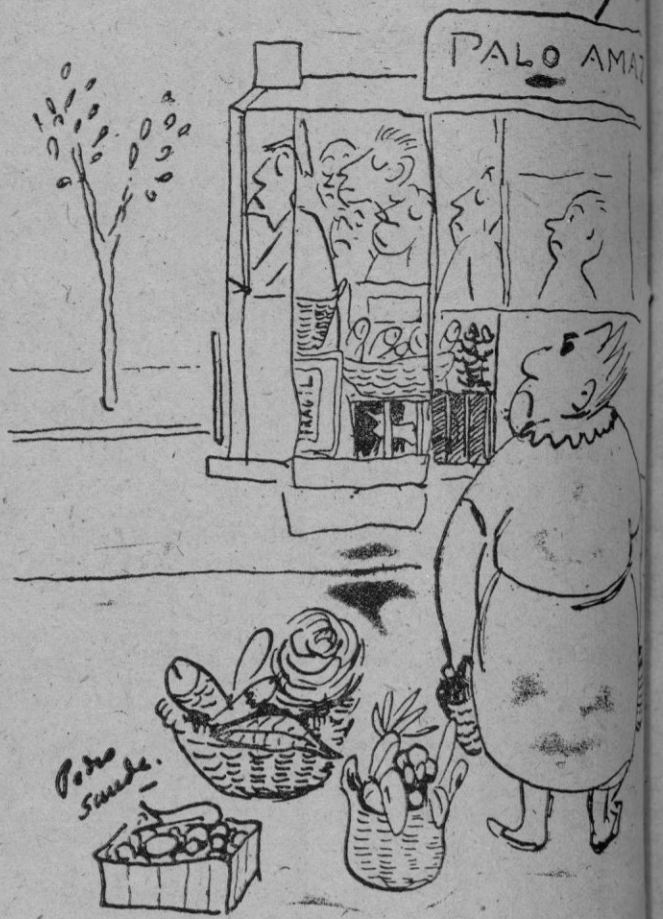
Los tranvías de 9 a 10 1/2 de la mañana —Es un abuso! No deberían admitirse pasajeros a las horas en que los tranvías son de mercancías!