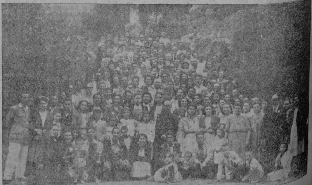
Los peregrinos reunidos en los alrededores del Monasterio