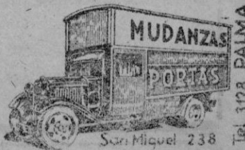
San Miguel 238 Tel. 3128 PALMA

ESPECIALIDAD DE TRASLADOS A LA PENINSULA SIN EMBALAJE. GARANTIDOS