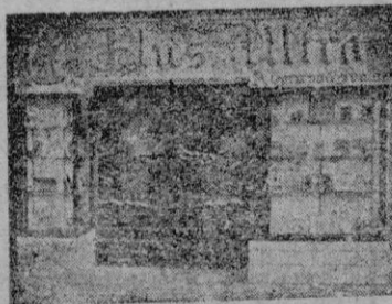
Plaza Sta. Catalina, Tomás, 18 Palma de Mallorca

Traducido especialmente para LA ALMUDAINA