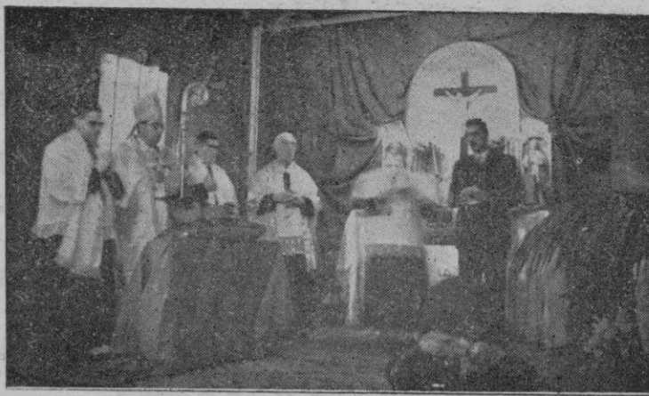
El Excmo. e Ilmo. Sr. Obispo Coadjutor en el acto de la entronización