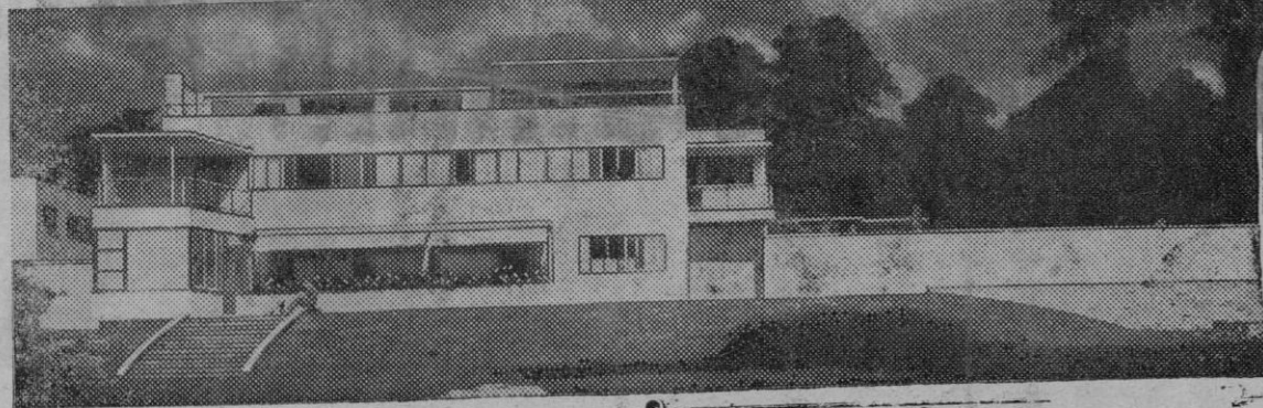
Una bonita casa de campo diseñada por un arquitecto británico, según los nuevos métodos modernos de construcción. Consta de dos pisos, jardín, garaje, y una magnífica terraza abierta.