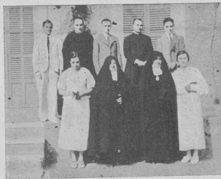
Catequistas de S. Josep del Terme, acompañados del Sr. Ecónomo de aquella parroquia y de nuestro Director.

Reinó mucho entusiasmo durante todo el acto, que dejó grato recuerdo en todos los