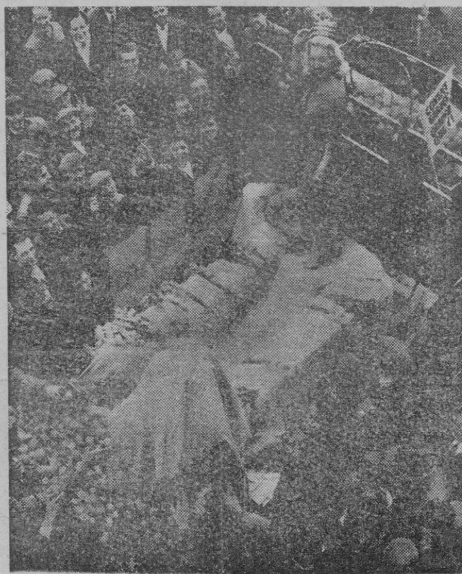
La actriz de la TV inglesa Shere Winton ha sido elegida por los cargadores del Coven Garden «Reina de la naranja del Mediterráneo», rindiendo con ello homenaje a la fruta que les lleva la belleza, el sol y la alegría de España.