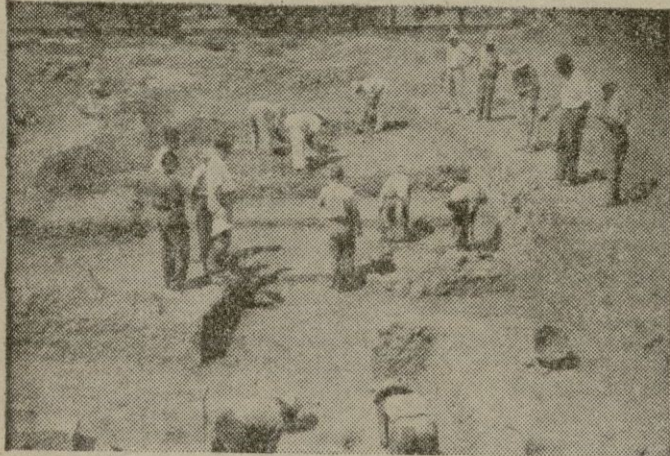
Excavaciones de la Fundación Bryan en Pollentia

La Arqueología mallorquina ve como se cierra un año fecundo de su historia. El campo — tan abandonado — de nuestros estudios prehistóricos, ha recibido una vitalización extraordinaria a lo largo de este 1957 que nos deja, fruto de una actividad escondida, callada, que sin trascender al público profano empezó a dar muestras de lo que puede ser el estudio racional de las riquezas ocultas de nuestro pasado.