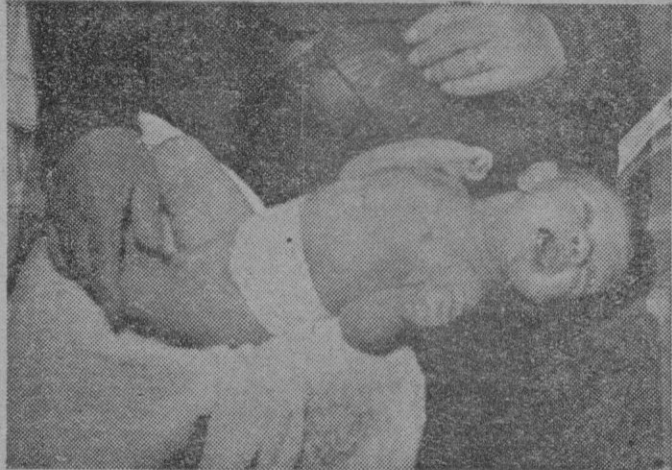
El primer "quinto" del reemplazo de 1979, dando su primer vigoroso y entusiasta "Viva España" en la Noche Vieja del Año 1957.