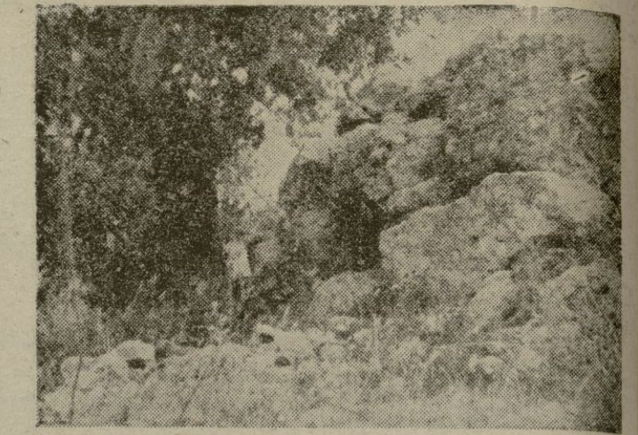
Talayot de So'n Puig (Puigpunyent).—(Cliché Rosselló Bordoy)

La "Fundación Bryan" ha explorado asimismo la cueva de "sa Tancà" y la necrópolis de "Ca'n Banyà", de Alcudia, y salvado de una rápida destrucción la necrópolis de "Son Rea" y "Ca'n Placafort", ejemplar único en todo el ámbito peninsular, estratigráfico,