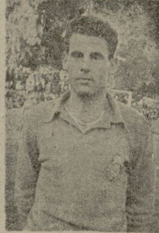
SALOM uno de los jugadores lluchmayorenses que más contribuyeron a la victoria sobre el "Mallorca".

"España" pero se sigue temiendo al mismo tiempo, y no queda mas que temerle ya que es el único equipo que ha vencido al