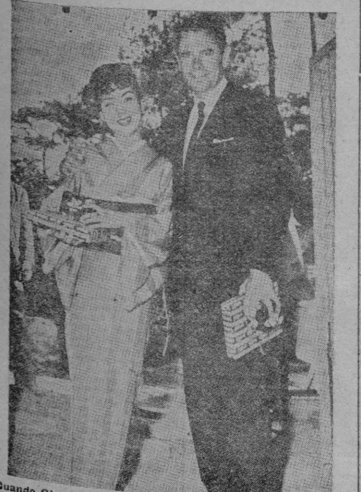
Quando Glenn Ford estuvo en el Japon para filmar la película "La Casa de Te de la Luna de Agosto" quiso conservar un agradable recuerdo de la misma retratándose con Machiko Kyo, una de las mejores estrellas del cine japonés, que también trabaja con él en dicho film