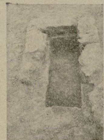
Tumba romana excavada de la necrópolis de Ca'n Banyà (Alcudia)

pre que me hablan de evasión de un medio ambiente, traduzco que el ansia de evadirse es odio hacia lo que nos circunda. En tal caso, tu sentirás odio a tu hogar, a tu ciudad, a tu trabajo, a los que son tus convivientes. El supuesto es muy grave, penosísimo de concebir. Prefiero creer que adoptas una palabra sin conocer su importancia y profundidad. Esto nos ocurre todos los días, y es una de las enfermedades de nuestro tiempo, en el que aseguran triunfar la cultura. Puede ser que necesitemos, ante todo, dilucidar lo que es la cultura, palabra confusa. Voltare — ya ves que no soy cavernícola como acaso hayas