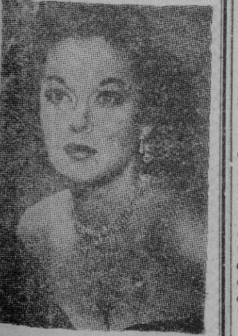
SUSAN HAYWARD su sinceridad. Es franca y abierta. Tiene una mente propia y nunca vacila en expresar lo que la agrada o desagrada. Su más preciada posesión es su abundante y sedosa melena roja y su mayor ambición es complacer al público en sus actuaciones.

Como tipo humano, también, era una persona fuera de lo corriente. Fué un hombre extraño con la prestancia del gran señor, amante del fausto y del trabajo, con un espíritu muy inclinado a la aventura. Sentía un especial placer para el riesgo. Siempre se expuso al riesgo, pero no fué alcanzado por él. Las circunstancias le favorecieron porque era un hombre de acción que nunca se conformaba con las ideas. A fuerza de creer en su buena estrella tuvo éxito y convención con su talento a las grandes que tenían el dinero para llevar a cabo sus grandes empresas. Llegó a convertirse en un verdadero hombre de negocios, pero sin renunciar a sus ambiciones artísticas. —El dinero es algo que nos promete muchas cosas —solía decir—, pero que luego no da nada. Claro que hay que tenerlo para poder despreciarlo. El primer problema que se le planteó en su vida a Alexander Korda fué el dinero. A los catorce años, en su pueblito natal de Turkeve, en Hungría, se encontró huérfano de padres y con dos hermanos menores que él a su cargo. Para ganar el sustento de los tres se hizo pasante y, más tarde, periodista en Budapest.