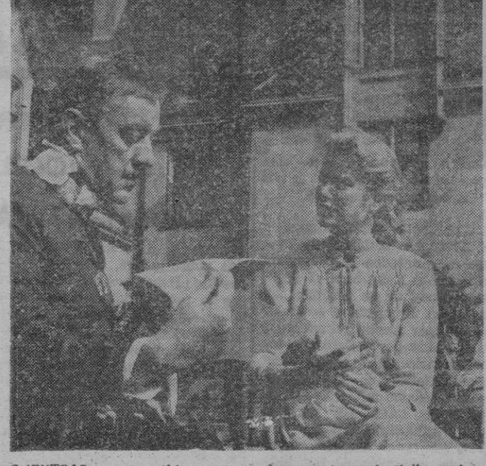
MIENTRAS su prometido corre por las carreteras de Hollywood —y se da algún topetazo que otro— su novia Grace Kelly "rueda" preparando las escenas de su nuevo film "El Cisne", junto al actor Alec Guinness