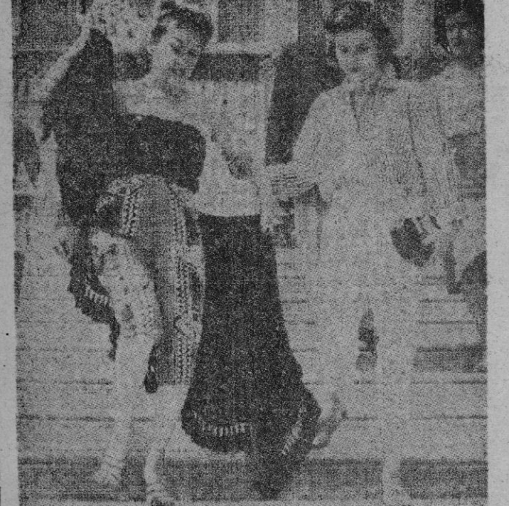
Gloria Swanson, lejos del "Bulevard del Crepúsculo" ("El ocaso de los dioses"), desciende la escalinata del Lido, en Venecia, en donde se celebra estos días el Festival Internacional de Cine. Gloria, que va a cubrirse con una capa veneciana, es acompañada de su joven y bella hija Michele. El atuendo de Gloria llamó la atención de Venecia. Lo creemos.

Por virtud de la resolución de la ONU del 12 de diciembre de 1946, se prohíbe a España el ingreso en este organismo y en cualquiera de sus agencias especializadas, y se recomendaba a los países miembros que retiraran (Continúa en sexta página)