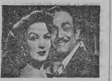
Una escena con María Félix y Jorge Negrete

La producción mejicana, con la agrupación de Periodistas cine- matográficos del país tuvo la ocurrencia de editar un film que al tiempo que exaltara los valores humanos y permanentes del pe- riodismo "de calle" —sucesos, anécdotas, crónica del vivir en suma—, fuera algo así como un desfile de las más conocidas caras del cine hispano americano: me- jicano, argentino y español. Y aquí esta "Reportaje" sir- viendo aquel propósito inicial y pocas cosas más. Emilio Fernán- dez —el famoso director de los mejores films mejicanos y de las más exquisitas interpretaciones de Dolores del Río—, en esta cinta es un director perfectamente co-