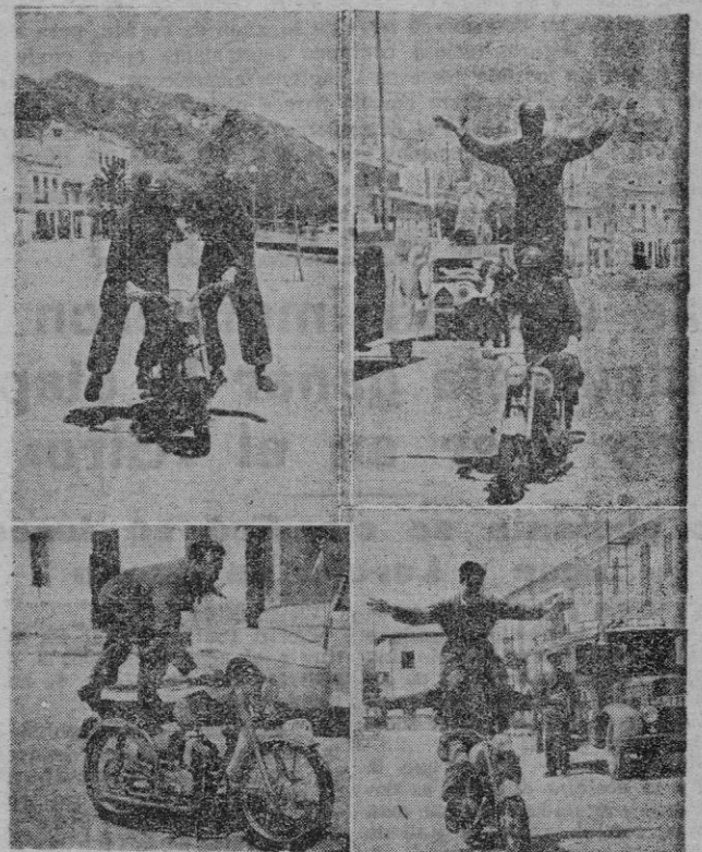
Nada tienen que envidiar a los famosos motoristas del "Tour", los que presentó MINACO en la Caravana Comercial de la XII Vuelta Ciclista a Mallorca. En la "foto", varios momentos de su exhibición en el Puerto de Pollensa

Estas exhibiciones se hubieran repetido en otras partes, pero la premura del tiempo, la proximidad de la caravana de los corredores lo impidieron. Con todo, esto son números que quedan apuntados para ulteriores organizaciones. RAT