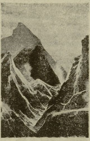
Quién trazó esta visión de Marte se olvidó de quitar las montañas

AMSTERDAM. — La infinidad del mundo astral está llena de enigmas y misterios. Uno de los problemas más interesantes se planteó por la exacta observación de Marte, miembro vecino de nuestro sistema solar. Por primera vez en 1877, el astrónomo milanés Schiaparelli observó finas líneas que, en forma geométrica, cruzan el planeta de polo a polo. Estos trazos, difícilmente visibles, se interpretaron como canales. Su rectitud y forma geométrica indujo a algunos investigadores a suponer que dichos canales representan gigantescas obras de irrigación, proyectadas y realizadas por seres racionales.