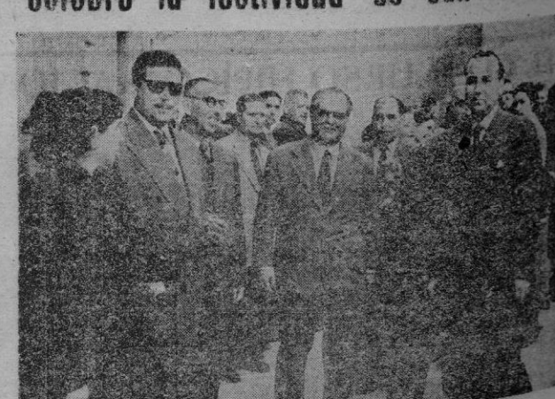
El Delegado Provincial de Sindicatos, con otras personalidades, a la salida de la santa misa.

En la mañana de ayer, en la iglesia de los Padres Capuchinos, se celebró a las nueve, una misa organizada por el Sindicato Provincial de Frutos y Hortícolas con motivo de la festividad de San Isidro Labrador, en la que ofició el Rdo. P. Felipe Neri de Palma, capuchino.