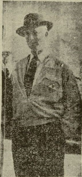
El Rey Leopoldo de Bélgica

ilustre, de forma que el nuevo Gotha sigue siendo tan completo como en sus mejores tiempos. Y