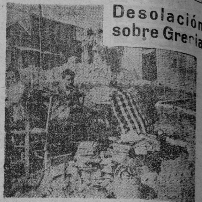
Desolación sobre Grecia

En Inglaterra, el número de muertes diarias es también de catorce. Sin embargo, hay que tener en cuenta que a pesar del aumento en el número de vehículos de tres a cinco millones en los últimos 15 años, el índice de accidentes es el mismo de la pre-guerra.