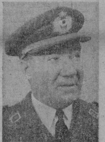
EL TENIENTE GENERAL GONZALEZ GALLARZA

Se aprobó también una moción en virtud de la cual la convención entrará en vigor hasta que sea ratificada por el 50 por 100 de los países firmantes y cuyos porcentajes deberán sumar el 75 por 100 de los gastos presupuestarios. Inmediatamente después se levantó la sesión y se han declarado concluidos los trabajos de la comisión de presupuestos. — Cifra.