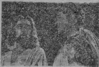
Una escena del film.

Película, ésta a que vamos a referirnos, que no muestra nada bueno y bastantes cosas malas. Ni siquiera la presencia de Rambal, hijo, saca de su mediocridad esta cinta. Precisamente él es de los que se muestran más teatrales y fríos, y que acaban con lo poco bueno que pueda tener la película. La fotografía, ambientación y di-