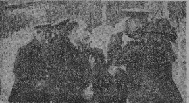
Uno de los tripulantes del aparato francés salvado milagrosamente, habla con un jefe del ejército español.