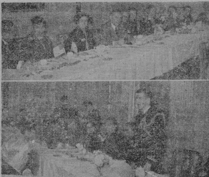
Los momentos del homenaje rendido ayer en los "Amigos de Mallorca" al compositor norteamericano Mr. John Hausermann.

Manifestó su más íntima adhesión al acto que ponía de relieve los sentimientos de un artista que cultiva la mejor de las artes: la música; a un artista que, por artista y norteamericano, es un verdadero hombre de bien, pues, así como España creó civilizaciones, Norteamérica no sólo las conserva, sino