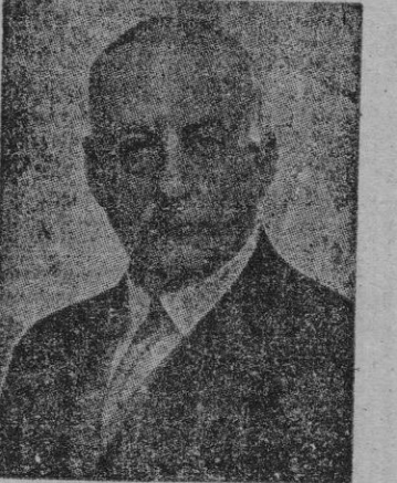
D. MIGUEL PRIMO DE RIVERA

llamó romanticismo de la historia y de su inseparable, la leyenda. Romanticismo o sentimentalismo irraguados en la primera mitad del siglo XIX por Próspero de Bofarull, continuados por gentes de su mismo apellido, por Joaquín Rubió y Ors y paralizados por la generación que se encontró, de bruces, con la inexorable realidad del 18 de Julio. En esta fecha, la obra encaminada a elaborar dos historias de España, divergentes y beligerantes, contradictorias y enemigas, halló su fruto en el caos y la tragedia. Casi todos sus cultivadores aparecieron espantados, y aún llegó a sospecharse que estaban contritos. Estamos viendo que esa contrición era producto de la caridad crisilana. El espanto físico —no espiritual— duró tanto como la reconquista, heterogénea composición provincial por una mayor a de heticiana, de la región catalana, realizada por cierto, con el mas escrupuloso tino y la mas grande preocupación por salvar todas las fuentes de riqueza que aún no habian sido dañadas. Duró también hasta que dió sus frutos la ley del desbloqueo monetario, y se alzó, arriba, muy arriba, la hermosa potencialidad regional económica.