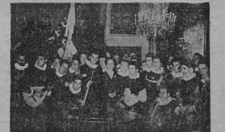
La Tuna Universitaria del S. E. U. obsequia con un concierto a la esposa del Caudillo y a sus nietas, durante la visita realizada por dichos universitarios al Palacio de El Pardo