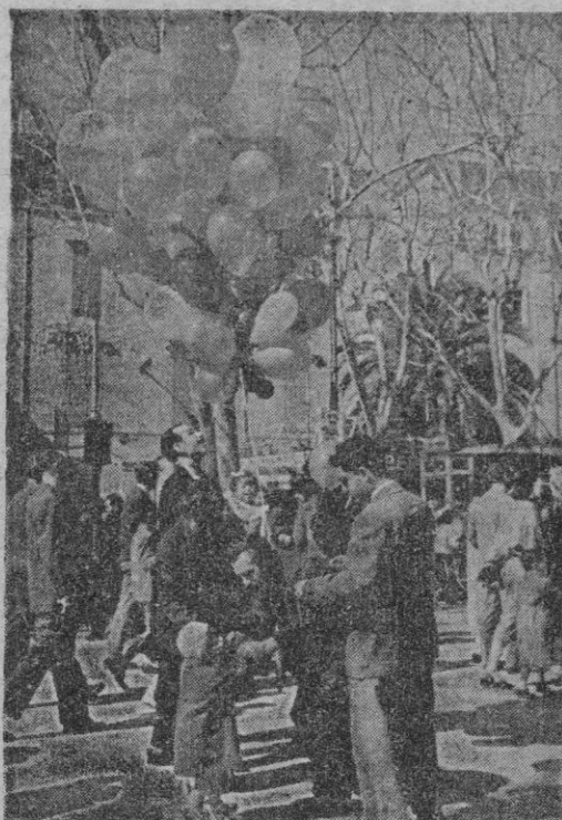
que produce más tristeza en el alma de los niños: que explote. Si. Compre un globo a su hijo. Grande, de color brillante. Que disfrute y que así contribuya a que no desaparezca esta estampa tan dominical y tan palmesana y universal a la vez.