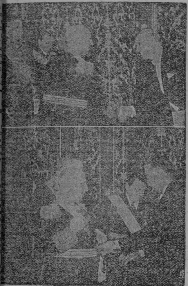
La foto superior el nuevo Embajador de los EE. UU. presenta sus credenciales al Caudillo. — En la inferior el Embajador de España impone a S. E., la más alta condecoración de su país. Dos ejércitos de distintos hemisferios proclaman así su adhesión a España, y abren paso noblemente con las armas de la verdad.