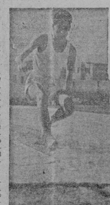
Con gran esplendor continúan las competiciones deportivas organizadas por el Frente de Juventudes. En las fotos de "Juanet" un momento de las pruebas salto de longitud y 600 metros lisos