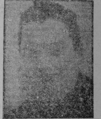
tualmente el amigo Carrasco, también es un poco, bastante, partidario del Mallorca.

—¿Cómo terminará el partido? —Le preguntamos. —Ahora están 2-0, puedes poner 5-1. —¿No serán muchos goles? —No lo serán si tienes en cuenta de la forma en que se está jugando. —¿Te ha gustado el equipo? —Muchísimo. Se ha recuperado totalmente, tanto que no se perderán más puntos en casa. —¿Se ganará algún otro positivo? —Sí; donde nadie lo espera, es decir, en Jaén. De allí se traerán, al menos, un empate. —¿Cómo marcha el Salamanca? —No me habies de ello. Desde luego es uno de los mejores equipos de España, pero no tiene suerte, que quieres que te diga. No importó nos dijera más, pues eso de la mala suerte, ya sabemos lo que quiere decir, que anda por los últimos lugares. Que se le va a hacer, no todos pueden ocupar el primer puesto.