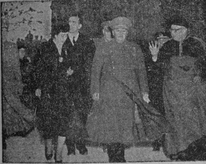
JAVIER (NAVARRA). — S. E. EL JEFE DEL ESTADO, ACOMPAÑADO DE SU ESPOSA, MINISTROS Y AUTORIDADES A SU LLEGADA A JAVIER, EN CUYO CASTILLO SE CELEBRÓ EL ACTO DE CLAUSURA DEL N. CENTENARIO DE LA MUERTE DEL SANTO.