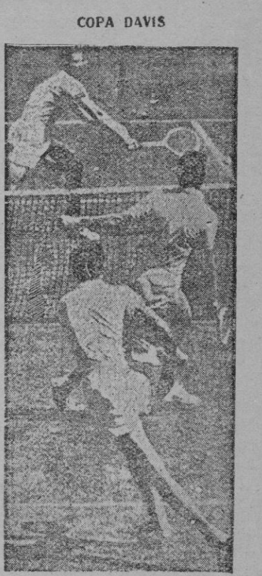
COPA DAVIS El popular trofeo tenístico ha quedado en posesión del equipo australiano, al lograr éste la victoria sobre el conjunto norteamericano. Vemos a los jugadores australianos Ken Mac Gregor y Franck Sergman, en primer término, compitiendo con el norteamericano Tony Trabert.