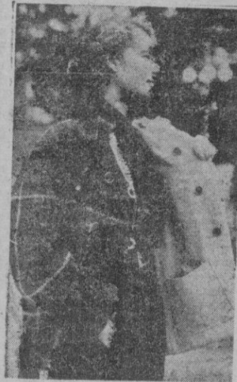
Chaqueta reversible. Creación de Vincent Mehnert

estudio particular, ya que debe permitir los movimientos más violentos sin molestar nunca. La silueta se termina por la "cajou-