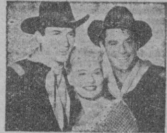
Los principales intérpretes de la película.

Estamos en el escenario de la antigua y siempre nueva película con indios, terriblemente malintencionados, silentes en sus ataques, y vamos a vivir las consabidas jornadas junto a los valientes soldados destacados en los fuertes, junto a las mortañas de Nuevo México.