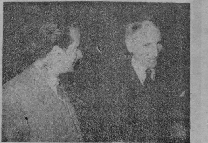
El Embajador McVeagh y nuestro Redactor

El embajador de los Estados Unidos en España pudo cambiar con nosotros unas palabras en el Hotel Mediterráneo donde se hospedó. Mr. Lincoln Mac Veagh se presenta desprovisto de todo protocolo y su figura es afable y sencilla. No representa sus 62 años de edad, cumplidos, y es, en realidad "un buen ejemplo de intelectual diplomático". Mac Veagh pertenece a una familia de sólida tradición diplomática y su tatarabuelo era primo de Abraham Lincoln. Ha sido Ministro plenipotenciario en Grecia y en la Unión Sudafricana, embajador cerca de los (Continúa en cuarta pág.)