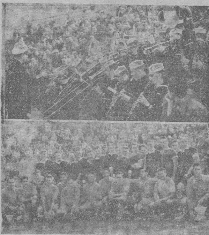
En la parte superior, la banda de música del "Midway", durante su actuación en "Es Forti". — Abajo: Los equipos antes de iniciarse el partido.

Ayer tarde se celebró en el campo de "Es Forti" el encuentro amistoso concertado por los marinos de la Escuadra norteamericana surta en nuestra bahía y el R.C.D. Mallorca.