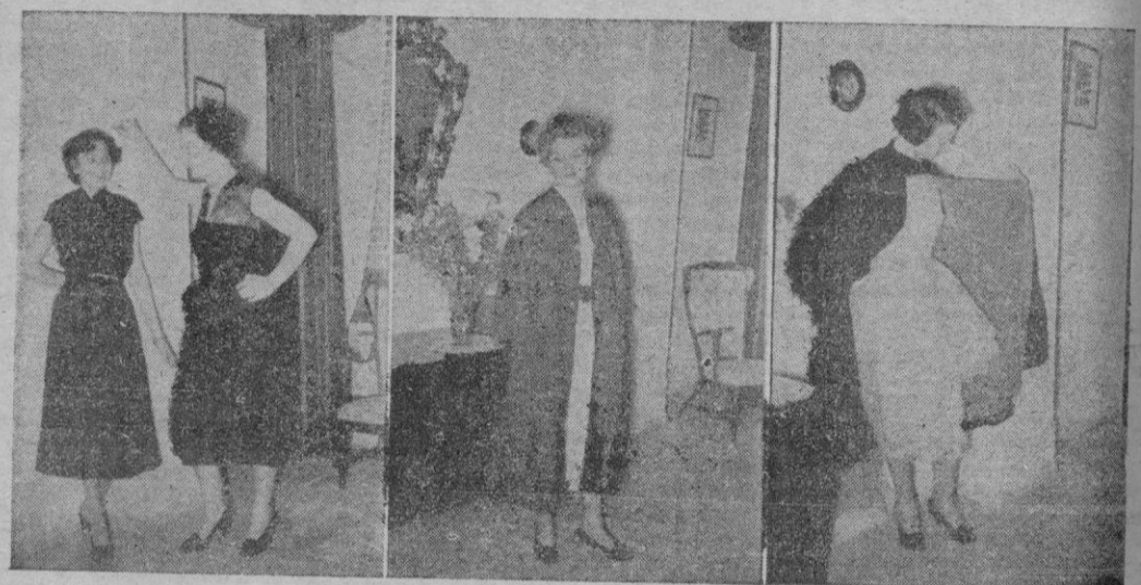
Cuatro finas creaciones de la extensa colección presentada por la firma de alta costura M. PINO en las exhibiciones que finalizaron el día 20 y cuyos elogiosos comentarios continúan ocupando lugar preferente entre los temas tratados por la distinguida y elegante sociedad de Palma.