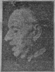
José María Peman

Todo esto lo venían ya esclareciendo y puntualizando así los orientalistas eruditos. Pero, todo esto, de pronto, empieza a tener una versión actuante y eficaz cuyas últimas consecuencias tiene que sacar España. Porque, de pronto, el mundo occidental se encuentra con que el arco que quiere cerrar en torno del gran peligro ruso, no acaba de soldar, del todo, por abajo. Hay una ancha brecha indecisa que se llama Oriente Medio, cuya moral cuyo deísmo y tuyo personalismo le acerca a Occidente, pero cuya pobreza, cuyo resentimiento y cuyo fatalismo, lo pueden hacer caer hacia el Oriente... Y es este el momento en que hay que concederle a España un crédito de razón, diálogo y simpatía frente al mundo árabe. Porque su orientalismo no quedó agotado al servir de modelo a Victor Hugo o a Washington Irving, con perdón de los paisanos de tan insignes autores.