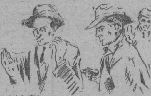
«La Policía española en acción.» He aquí el titular de nuestra serie de reportajes policiales que van adquiriendo importancia y emoción. (Lea el reportaje de última página y su sed de aventuras será satisfecha, lector)