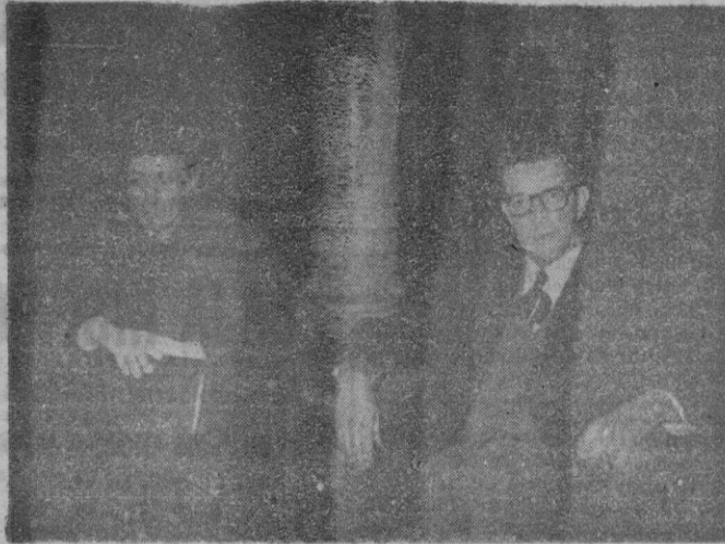
Los Sres. Rivera en su visita al Círculo.

Sean bienvenidos a nuestra tierra los señores Rivera, he podido comprobar lo interesado que el lector español está por la literatura norteamericana, que conoce bien en todo aquello que vale la pena conocer.