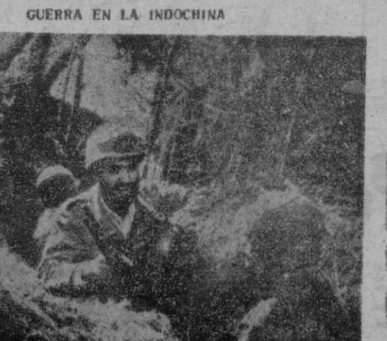
Fuerzas francesas ocupan una trinchera en Indochina.

Karachi, 22. — Nuevamente se han manifestado en forma violenta los estudiantes de Dacca (Pakistán central), en apoyo de su pretensión de que sea declarado idioma oficial en aquella provincia el bengalí, y la policía ha tenido que disparar, matando a tres e hirviendo a dieciséis de los manifestantes. En los sucesos de hoy fueron incendiadas las oficinas del "Morning News", único diario de lengua inglesa del Pakistán oriental, y los manifestantes pidieron que los bomberos extinguieran las llamas. Se han practicado setenta detenciones. Se afirma que el jefe del Gobierno provincial ha presentado al parlamento una moción a favor de la declaración del bengalí como lengua oficial. — Efe.