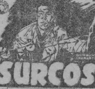
Director J.A. NIEVES CONDE