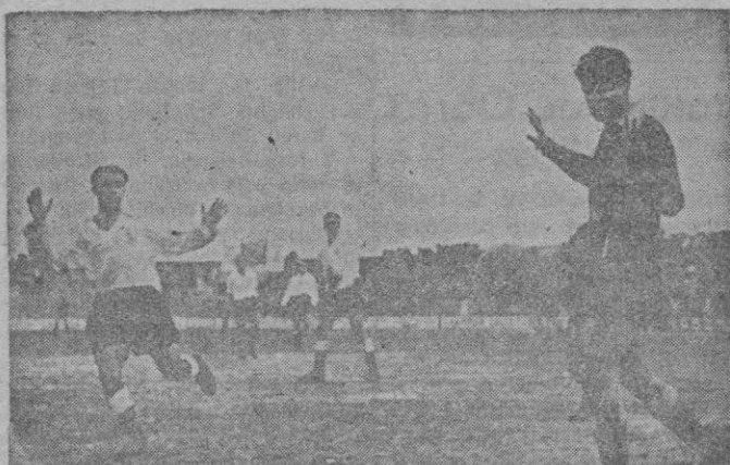
"Cuidado que ensucia". Esto parece ser que dicen estos dos jugadores del Cartagena. No obstante, se trata de uno de los muchos remates que salieron fuera, cuando ya se daba el gol por hecho.

Y así fué como comenzó el partido, que el "Mallorca" debía resolver a los primeros minutos, siguiendo las instrucciones recibidas de Satur Grech. Dió orden el "mister" mallorquínista de salir a todo tren, practicar juego alto. Y la táctica ordenada por Grech dió resultado, pues a los ocho minutos el marcador señalaba el 2-0 que debía ser el definitivo, aun cuando fueron muchas las ocasiones que se perdieron ante la meta visitante, unas veces por poco acierto en el tiro y otras debido al estado del terreno de juego. Después de los dos goles, es justo decirlo, el equipo local se limitó a defender la ventaja adquirida, haciendo alguno que otro "pinito" para aumentarla, pero sin descuidar la defensa cerrada de su marco.