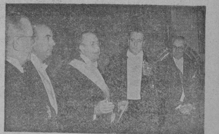
Madrid. — Un momento del acto celebrado en el Palacio de Viana con motivo de la imposición por el Ministro de Asuntos Exteriores señor Martín Artajo, a Mr. Stanton Griffis de dicha Gran Cruz, recientemente concedida por S. E. el Jefe del Estado. A dicha ceremonia asistieron varios Ministros del Gobierno español así como representantes del Cuerpo Diplomático y otras personalidades.