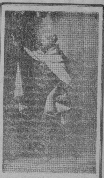
San Francisco de Sales, doctor de la Iglesia, Obispo de Ginebra y Patrono de los periodistas católicos.

El Cairo, 28. — El nuevo Primer Ministro egipcio, Ali Maher Bajá, ha convocado al Parlamento. El Gobierno de Maher Bajá está compuesto todo por independientes. Nahas Bajá, el Primer Ministro depuesto, ha dicho a un grupo de 20 ó 30 dardistas que se manifestaron frente a su casa: "Tened calma y no os manifestéis. He estado en contacto con el Primer Ministro, que me ha dado su palabra de honor de que proseguirá mi política hacia los británicos." La policía está buscando, al parecer, a los cabecillas de un complot para incendiar la ciudad. El Comandante de policía general El Joli Bey ha dicho que han sido detenidos 916, que se dedicaban al pillaje. Después de los disturbios del sábado, la ciudad ha vuelto al trabajo. Las tropas patrullan por las calles. — (Efe).