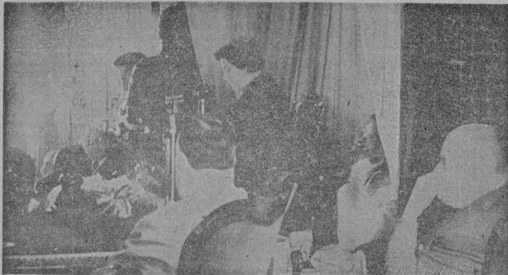
Cádiz.—La Delegada de la Sección Femenina, Pilar Primo de Rivera, durante su discurso en el acto inaugural de dicho Consejo, celebrado en el salón de la Diputación Provincial.—(Foto "Cifra" Gráfica).