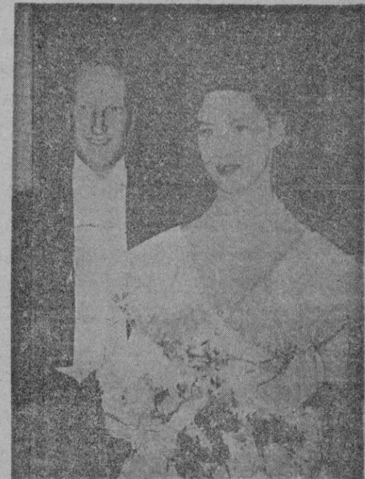
Londres.—La Princesa Margarita de Inglaterra y el Conde de Dalkeith. Circula el rumor en Londres que son novios; de que su compromiso se anunciará en breve. El Conde tiene 23 años de edad y desde hace tres años es uno de los acompañantes de la Princesa.