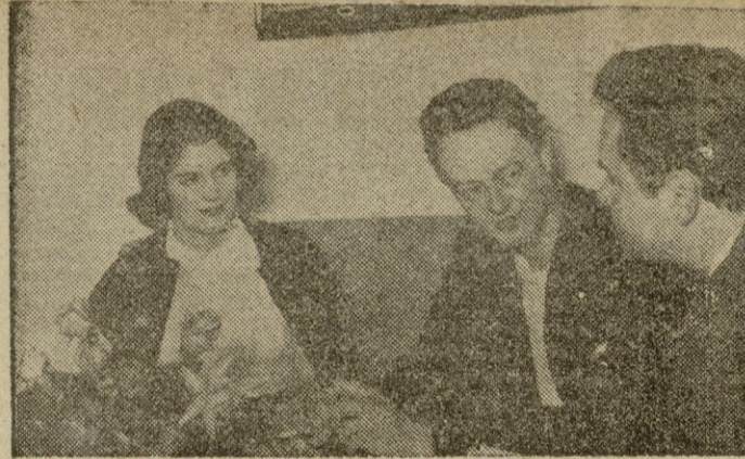
Los Marquesses de Blandford, en el Hotel "Maricel" charlaron brevemente con uno de nuestros Redactores. (INFORMACION EN PAGINAS INTERIORES)