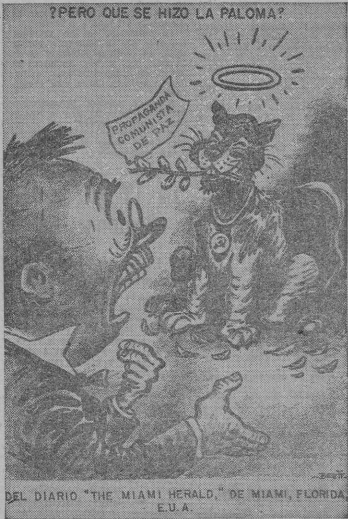
DEL DIARIO "THE MIAMI HERALD," DE MIAMI, FLORIDA, E.U.A.

No se necesitaba, empero, un recuento oficial, para comprobar esta gran verdad mundial.