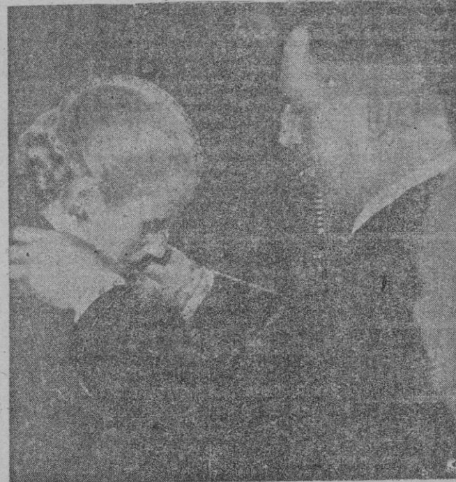
El Presidente de la República argentina, don Juan Domingo Perón, impone a su esposa la condecoración de la Lealtad en el día de la celebración de su advenimiento al Poder. Esta es la primera fotografía de la ilustre dama argentina después de su reciente enfermedad.