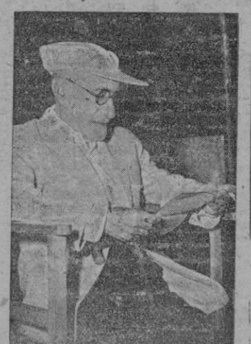
Don Jacinto Benavente, sorprendido en la terraza de su hotelito de Galapagar donde veranea, el domingo 12 de agosto, al cumplir los 85 años. El maestro lee algunos recortes de prensa que "hablan" de él y de sus comedias.