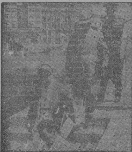
San Sebastián. — S. E. el Jefe del Estado y su esposa, se disponen a embarcar para realizar una pequeña excursión marítima.

Washington 16.— La flota de los Estados Unidos es hoy mucho más potente que en 1946, ha dicho el Secretario de Marina de los Estados Unidos, Dan Kimball, en el curso de un almuerzo celebrado en el "Overseas Whiten", club de periodistas norteamericanos que han actuado como corresponsales en el extranjero.