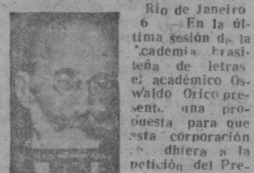
Menéndez Pidal, citado por las academias filipina, filipina y coreana.

QUIERE PEDIR PARA MENENDEZ PIDAL EL PREMIO NOBEL