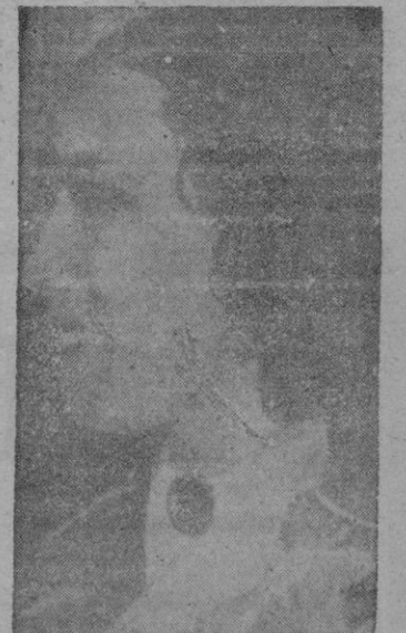
El asesinato de Pierre Chevalier, ministro del Gabinete Plevin, plantea un nuevo tipo de crimen pasional. Porque esta vez los celos de su esposa no eran provocados por su rival femenina, sino por la política que robaba el tiempo del marido. He aquí una foto de la protagonista de este suceso, que hoy apasiona a la opinión francesa.