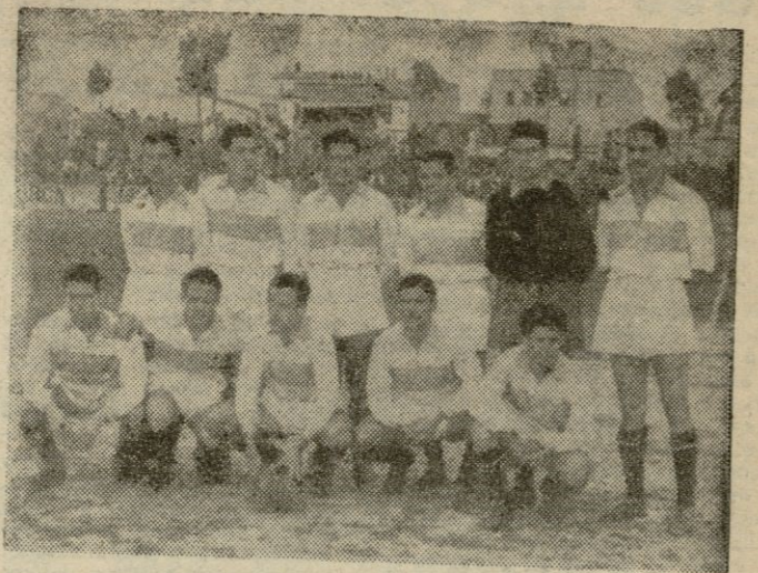
Este es el cuadro del Elche. Sobre el terreno fué todo lo contrario de lo que se esperaba