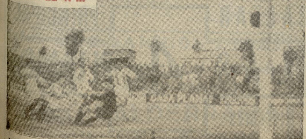
Miguelín, en el momento en que Vilches iniciaba la salida, fusiló el primer gol de la tarde