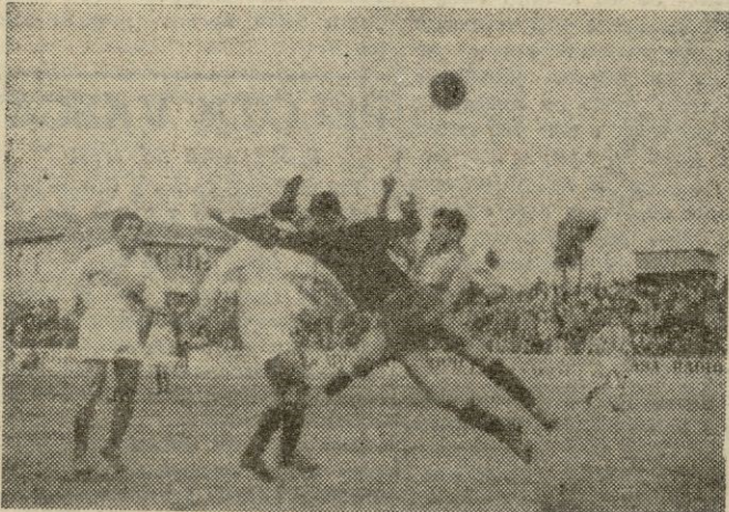
El remate de contra, de Barrera, salió alto, cuando Vilches no podía detener el balón. Y como en esta ocasión fueron muchas las veces en que "Doña Suerte" fué la aliada de los alicantinos