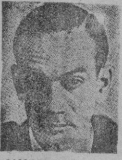
CAMILO JOSE CELA

Si, La distribución de loros sobre la superficie de la tierra es algo que aun no se ha abordado con serenidad suficiente. Un poco de aplomo nunca viene mal a nadie y, en este caso mejor que a nadie a los loros de Entrerrios, que forman legión.