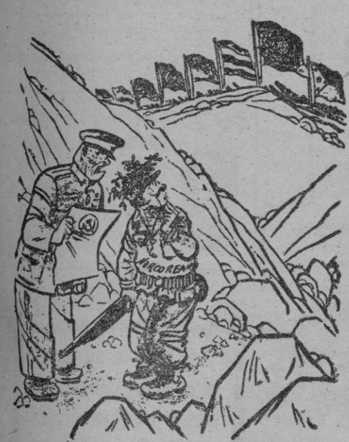
Tú lucharás a retaguardia. En tu nombre lo haremos nosotros

Con la nueva propuesta del Gobierno comunista de Pekín, nos llega a la memoria el recordatorio de aquella Commonwealth, muerta antes de nacer, a semejanza de la Mancomunidad de naciones británica, deshecha antes de existir. Ahí están esos problemas latentes de Corea, Formosa, Hong-Kong, Indochina, Birmania, dentro del sentido muelle de pacificación — no se desprecie la diversidad de puntos a tratar — llevados casi al absurdo de la división inglesa y americana, y por ende, el fracaso de solución a un problema, en el espacio y la categoría,