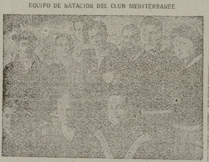
EQUIPO DE NATACION DEL CLUB MEDITERRANEE que actuó el sábado en la piscina del C. N. Palma y cuyo beneficio íntegro ha sido destinado por los organizadores franceses a beneficencia. Rasgo simpaticísimo que Palma agradece