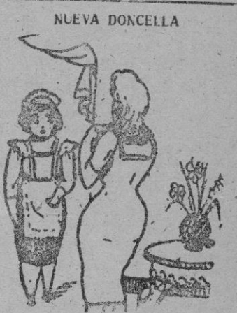
---Y sepa Vd. que en esta casa desayunamos a las nueve. ---Perfecto, pero si yo no me he levantado para esa hora no me esperen.

por es siempre la lengua. Esa vida aristocrática de la época del Rey Afonso, tan bella y liviana como la de todas las épocas para la sociedad más elegante y más hundida en los callejones de asuntos mundanos. Ese cinismo social, que sabe distanzar los verdaderos sentimientos y despegar a la gente momentos antes elevaba. Ese superficial vivir en la vida de sus hijos, por absorber sus horas en las visitas de fiestas y viajes.