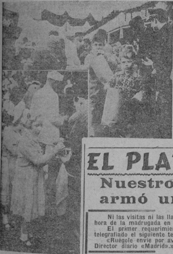
La grey infantil es obsequiada por los "fireros" con suculentas golosinas, y después una agradable visita a las atracciones (INFORMACION EN PAGINAS INTERIORES)