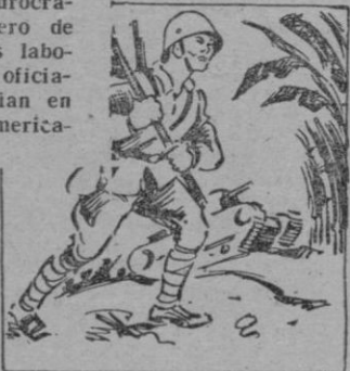
La guerra agudiza el hambre en China

El hambre de 1928 sólo fue un prólogo a la de 1931. Un telegrama de Reuter fechado el 4 de septiembre de aquel año hizo saber que "treinta millones de personas habían perecido en las inundaciones, y otros treinta y cuatro millones por el hambre y la peste". Era en el año en que la economía del mundo casi se paralizaba a causa de la superproducción. En julio de 1931 se rompieron los diques del Yang-Tse, e inundaron cuatro millones de kilómetros de tierra de "loes". Catástrofes parecidas se repitieron algunas veces. La última, en 1942.